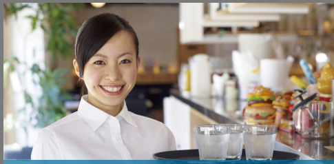
レストラン 女性スタッフでも手軽に使えるサイズと重量