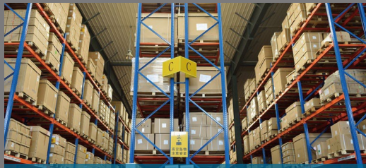
倉庫 中継器対応で、広範囲での使用も可能