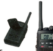
SHC-15 キャリングケース 標準価格1,995円 (本体価格1,900円)