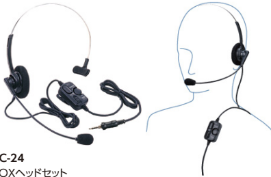
VC-24 VOXヘッドセット 標準価格8,400円 (本体価格8,000円)