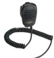
MH-57A4B スピーカーマイク 標準価格4,935円 (本体価格4,700円)