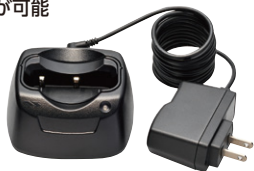
VAC-61 急速充電器セット 標準価格2,625円 (本体価格2,500円)