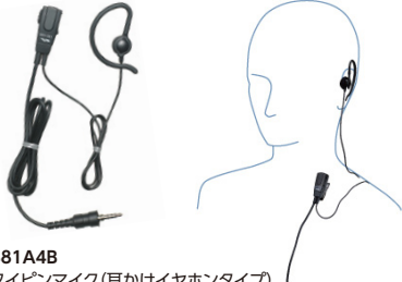
MH-381A4B 小型タイプピンマイク (耳かけイヤホンタイプ) 標準価格3,990円 (本体価格3,800円)